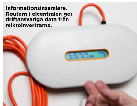
Informationsinsamlare. Routern i elcentralen ger driftansvariga data från mikroinvertrarna.

Varberg är en av många kommuner som satsar stort på minskad energianvändning. Energimyndighetens rapport "Öppna jämförelser – Energi och klimat 2014" visar att kommuner och landsting har minskat sin energianvändning i ägda bostäder och lokaler med uppemot en miljard